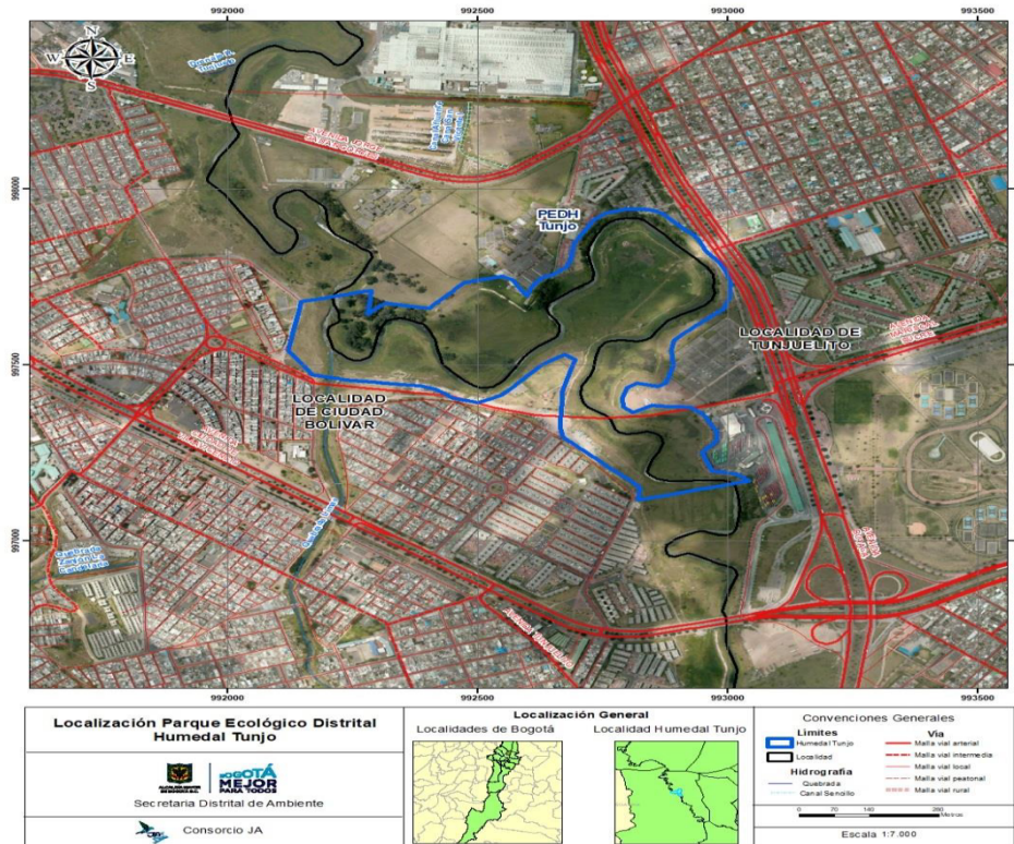
Imagen 1. Localización del Parque Ecológico Distrital de Humedal -PEDH Tunjo

Fuente: IDECA, adaptado Consorcio JA, 2016